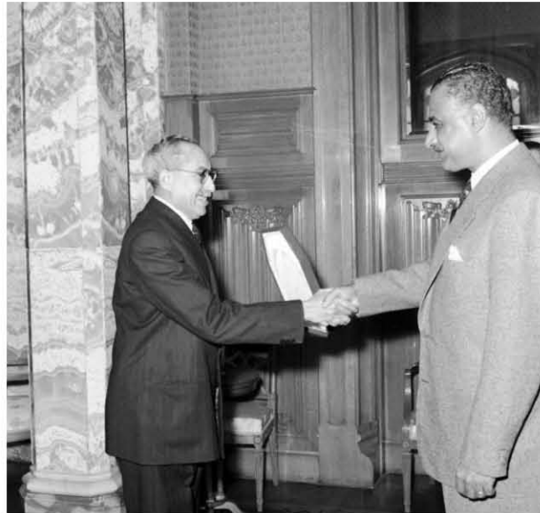
تسليم قلادة الجمهورية إلى توفيق الحكيم ١٩٥٨/١٢/١٧